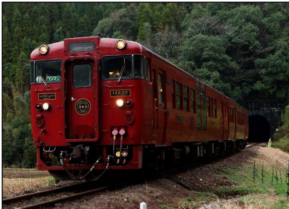
【特急いさぶろう・しんぺい】