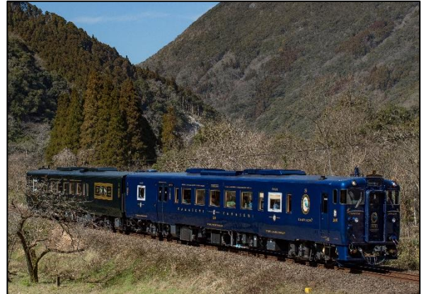
【特急かわせみ やませみ】