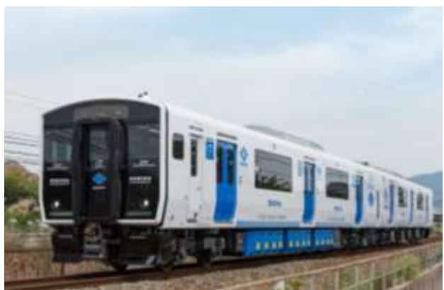
▲対象路線を走るBEC819系架線式蓄電池電車 (愛称「DENCHA」)