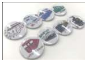
特製観光列車缶バッジ