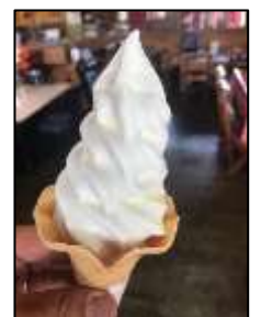
坊中亭 【ソフトクリーム】