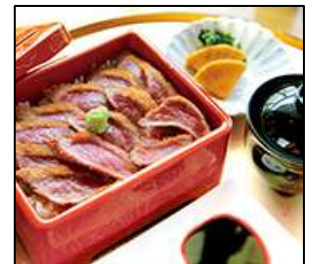
阿蘇はなびし 【あか牛炙り牛カツ重】