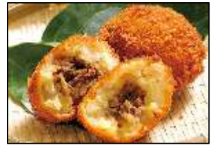
阿蘇とり宮【馬ロッケ】