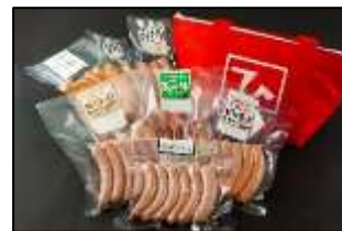
ひばり工房【ウインナー】