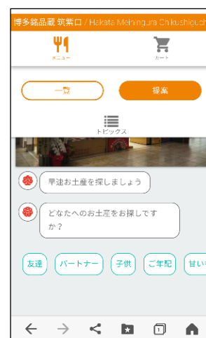
(アプリケーション画面)