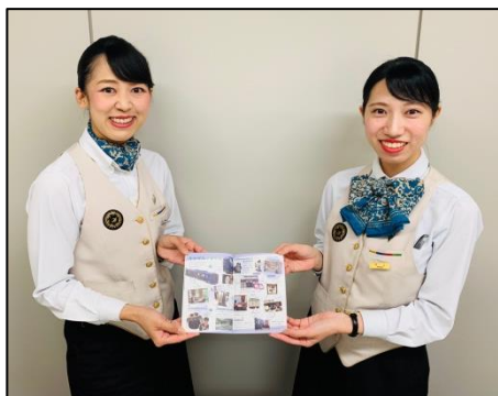
【イラスト付きのメモページ】