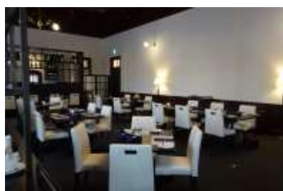
みかど食堂 by NARISAWA