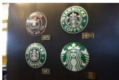
スターバックスコーヒー門司港駅店 (旧三等待合室)