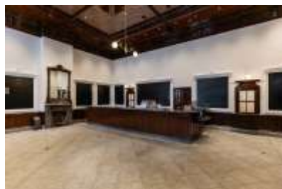
みどりの窓口・観光案内所 (旧一ニ等待合室)