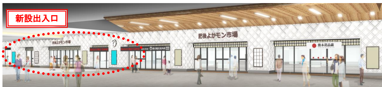
[駅コンコース側からのイメージ]