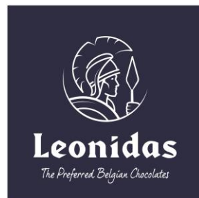
レオニダス [チョコレート]

ベルギー王室御用達のブランドショコラトリー、「レオニダス」が7月21日にオープンします。3月17日の「肥後よかモン市場」開業以降、4月25日の「トランドール」・「熊本銘品蔵」、6月27日「ボンボンシュシュ」のオープンを経て、今回をもって「肥後よかモン市場」の完成です。