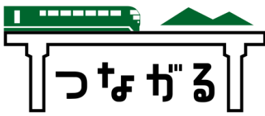
2018年7月14日、久大本線ぜんぶつながる。