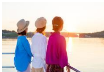
サンセットクルーズ