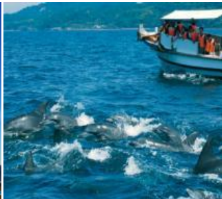
天草 イルカウォッチング