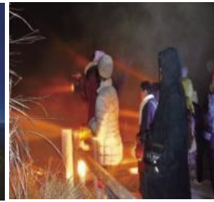
雲仙地獄 ナイトツアー