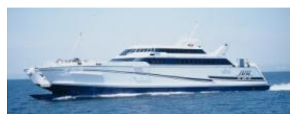
熊本フェリー オーシャンアロー