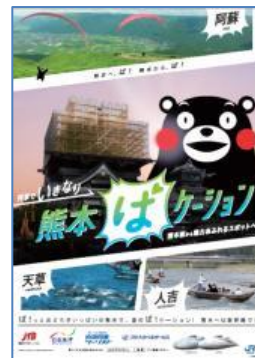
B1 ポスター ビジュアルイメージ

熊本城に寄り添う「くまモン」のほっぺは、上る朝日になぞらえてデザインすることで、復興感をよりイメージできるデザインとしています。