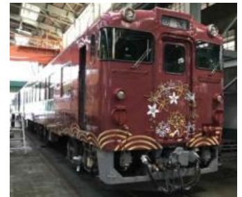
山陰線 観光列車「〇〇のはなし」