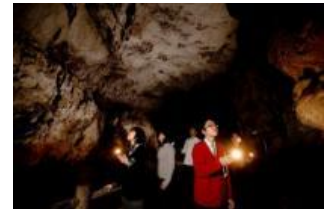
秋芳洞闇のロマン探検

DC期間中に県内各地で自転車ロードレースを開催。さらに、新山口駅でのレンタサイクル開始やサイクリトレインの運行など、サイクリスト向け特別なサービスを提供します。