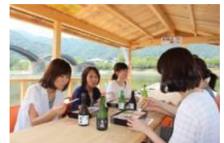
秋の錦帯橋「地酒舟」

錦川に浮かぶ遊覧船で、錦帯橋と紅葉に染まる秋景色を楽しみながら、岩国5歳の地酒の飲み比べや郷土料理のお弁当を味わえます。