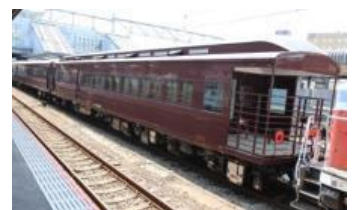
SL「やまぐち」号新製客車