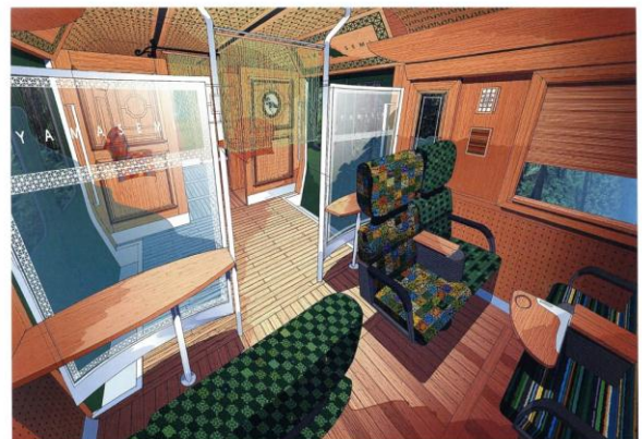
やませみ車内イメージ