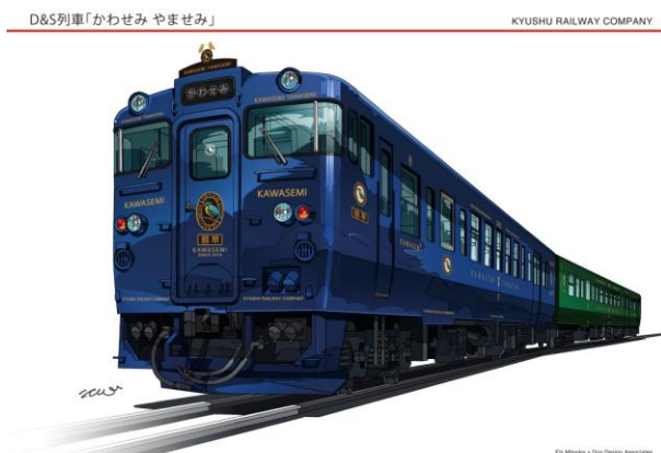
「かわせみ やませみ」外観イメージ

※「いさぶろう 1号」と「しんぺい 4号」は、熊本～人吉間を特急列車として運転します。