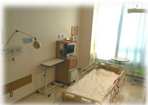
2 床 室