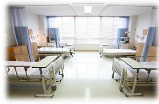
4 床 室