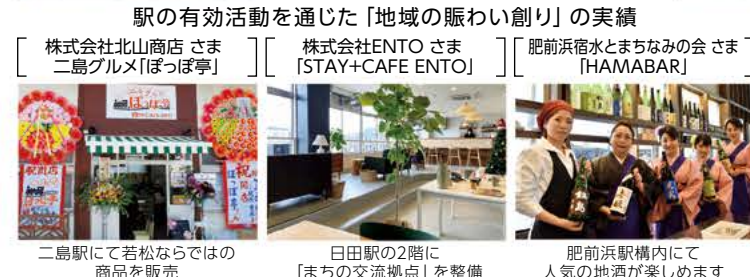
二島駅にて若松ならではの商品を販売