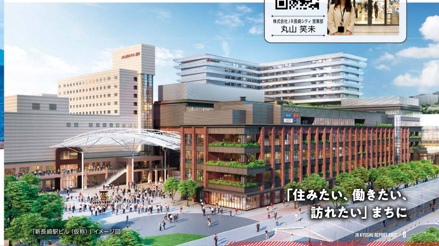
「新長崎駅ビル(仮称)」イメージ図