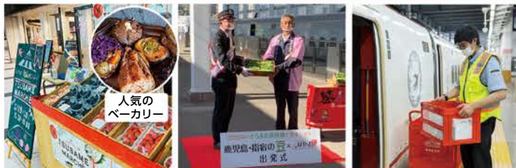
つばめマルシェ できたて・焼きたて・採れたてを駅へ即日輸送・即日販売