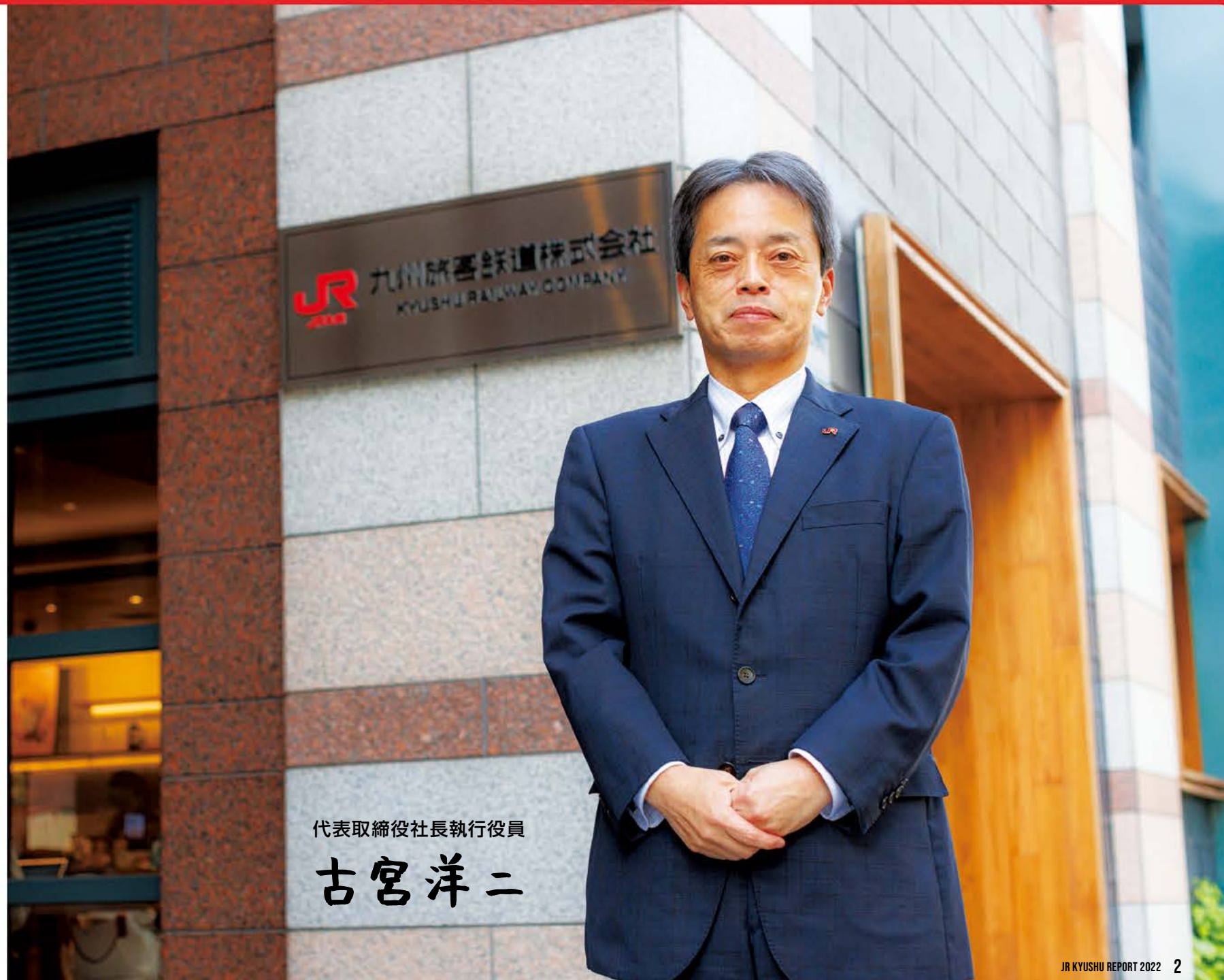
代表取締役社長執行役員

株主の皆さまにおかれましては、引き続き、当社グループの事業活動にご愛顧とご支援を賜りますよう、よろしくお願い申し上げます。