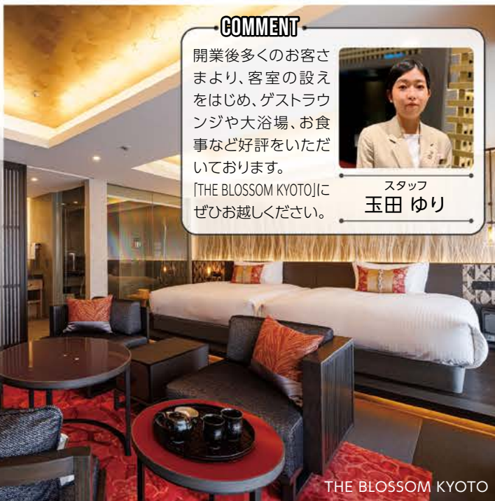
THE BLOSSOM KYOTO

レストランの朝食では、選べるメイン料理と、シェフ自慢の彩り豊かな料理が並ぶフルブッフスタイルで、心と身体が歡ぶメニューをご準備しています。