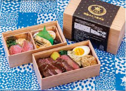
特製ふたつ星弁当