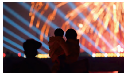
サプライズで上がった花火とイベント参加者

運行後の「流れ星新幹線」の反響は大きく、これまで繋いできた地域の皆さまとの絆を改めて感じる事ができました。