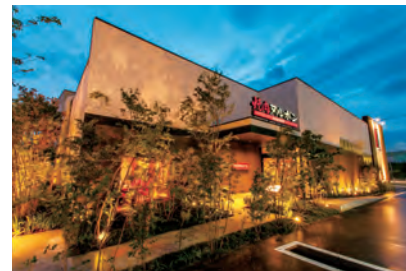
焼肉ヌルボンガーデン 新宮店 （福岡県糟屋郡新宮町三代西2-15-16）