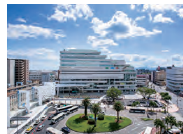
アミュプラザみやざき (株式会社JR宮崎シティ)