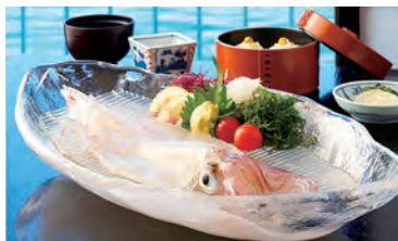
新鮮な“呼子のいか”をお楽しみください

萬坊は、これからも魅力あふれる海の恵みを発信し続けるとともに、お客さまに笑顔をお届けするために、新たな食の喜びを提案してまいります。