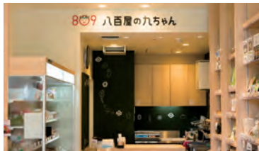
八百屋の九ちゃん千早店 (福岡県福岡市東区水谷2-50-1)