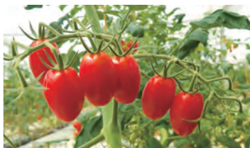
高糖度でスッキリした旨味のミニトマト「アンジェレ」(玉名農場)

また、直営店として福岡市内に5店舗、青果の販売を行う「八百屋の九ちゃん」を展開。自社農場の産品や九州内で生産された野菜や果物を中心とした、旬のものを販売しています。