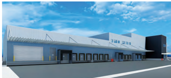
物流施設イメージパース

今後も積極的に物流施設の取得や開発を推進し、不動産事業の成長と拡大を図ってまいります。