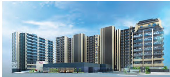
住宅×商業イメージパース

また、日々の暮らしを支える商業開発が加わることにより、お住まいの方や地域の皆さまに魅力的なまちづくりを進めてまいります。どうぞご期待ください。