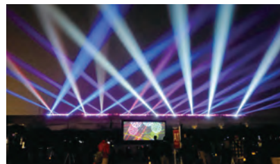
ビューイング会場にて(筑後広域公園多目的広場・運動場) ムービングライトとBGMに合わせた演出