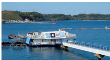
海中レストラン 萬坊 (佐賀県唐津市呼子町殿ノ浦1946-1)