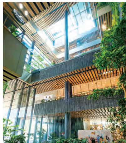
アミュプラザくまもと

いよいよ熊本の副都心としてのまちづくりがスタートしました。更なる開発を進め街の魅力を高めてまいります。