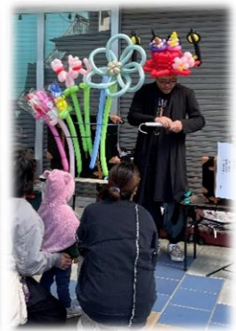
★バルーンアート(風助)