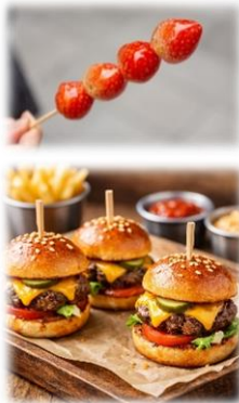
★世界の料理(NEXUS)※イメージ

また「別府八湯温泉まつり」が2026年4月1日から5日の間で開催され、4月5日は浜脇会場でもイベントが開催されます。別府八湯温泉まつりと合わせて、ぜひ東別府駅へお立ち寄りください！