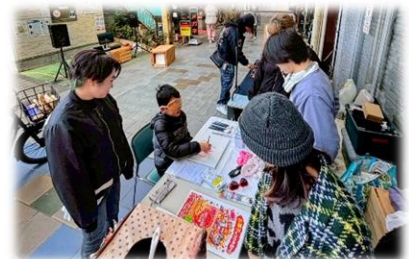
★ワークショップ (できる側/できない側、やめました)