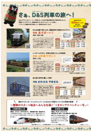
パンフレット中面(イメージ)