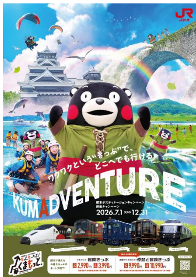
B1ポスター(イメージ)

熊本 DC 連動キャンペーン期間中、主に JR 九州及び JR 西日本の駅、JR 九州在来線列車内等で掲出するとともに駅頭のデジタルサイネージ等で放映してキャンペーンを盛り上げます。