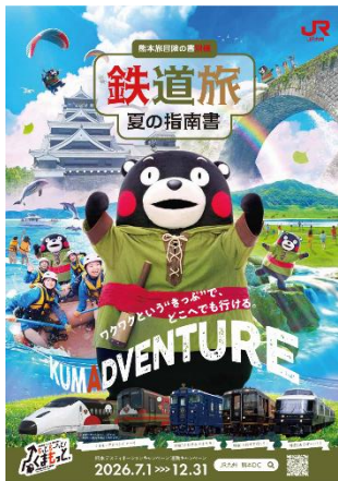
パンフレット表紙(イメージ)

2026年7月～9月までの夏版と2026年10月～12月までの秋版の2版を作成し、熊本の旬の観光スポットや観光素材をお客さまにお届けします。