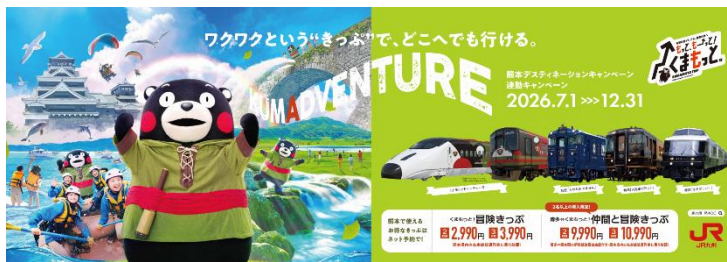
B3ポスターワイド(イメージ)