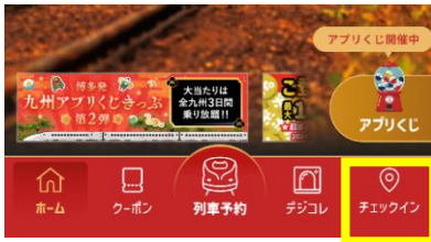
JR九州アプリ内の「チェックイン」

JR九州アプリで、対象駅の改札口でチェックインすることで、どなたでも参加いただけます。特定編成乗車チャレンジでは、専用のフォームにキーワードを入力することでどなたでも参加いただけます。