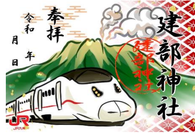
（寺社紹介と特別御朱印の一例）