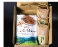
株式会社 宝珠山ふるさと村 東峰村しいたけカレーセット