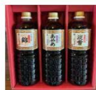
原次郎左衛門 醤油セット