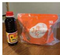
カネダイ 合わせ味噌、 刺身醤油セット