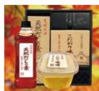
(有)日田醤油 天然だしの素 & こだわり味噌セット