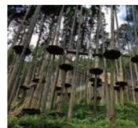
フォレストアドベンチャー 施設無料券