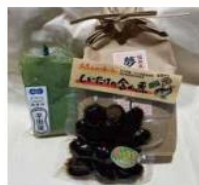
道の駅飲遊舎ひこさん 生産者協同組合 特産品詰合せ