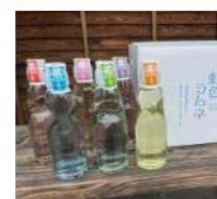
原次郎左衛門 紅色ソーダセット