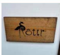
うなぎ鷺邸Rotir 2,000円割引券