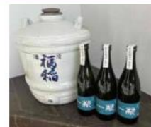
片岡酒造 東峰 一献