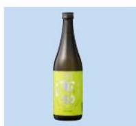
井上酒造(株) 麦焼酎「百助」 720ml