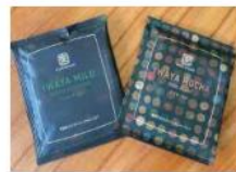
株式会社 宝珠山ふるさと村 東峰村オリジナルブレンド コーヒーバッグ 東峰村オリジナルブレンドコー ヒーバッグ(種類未定10g)2袋入