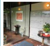
すてーき茶寮 和くら 2,000円割引券