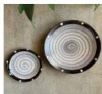
小石原焼 上鶴窯 小石原焼 陶器セット