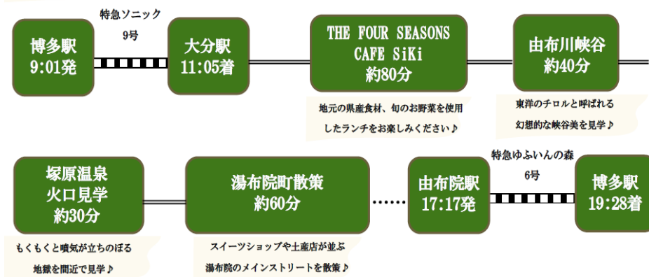
[凡例] ■■■ : JR ..... : 徒歩 === : 貸切バス (大分バス (仮))