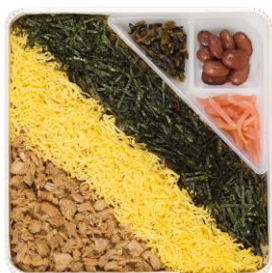
東筑軒 かしわめし 920 円