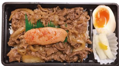
やまや 豊後牛博多明太弁当 1,400 円

豊後牛の焼き肉の上に、やまやの明太子を一本丸ごと乗せたボリュームのある一番人気の駅弁当。