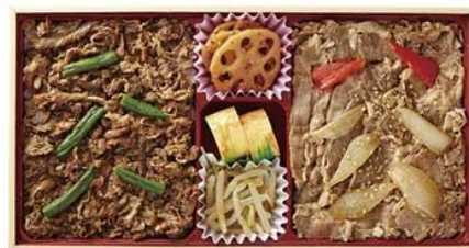
島川本店 島川特選焼肉弁当 1,200 円

豊後牛の焼き肉の上に、やまやの明太子を一本丸ごと乗せたボリュームのある一番人気の駅弁当。