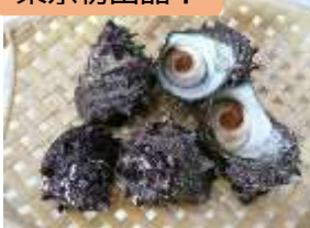
活きサザエ/山口県 こだま 844号⇒こだま728号 (東京駅 16:48着) ※5/17(金)のみ輸送 (JR西日本)