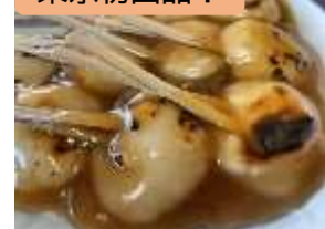
両棒餅(ちゃんぼ餅)/鹿児島県 さくら 544号⇒こだま 728号 (東京駅 16:48着) (JR九州)