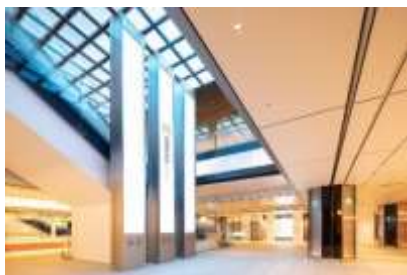
イベントスペース「スクエア ゼロ」

「グランスタ東京」は、「TRY NEW TOKYO ST.」(トライニュートーキョーステーション)をコンセプトとして、エキナカ初登場のショップや駅機能の拡充により、今までにないエキナカ空間を創造します。東京駅利用者のニーズを満たすことを超えた、新たな出会いや発見を創出することにより、今までのエキナカ概念を超える新体験を提供します。