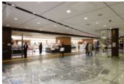
限定商品や限定ショップが並ぶ「銀の鈴エリア」