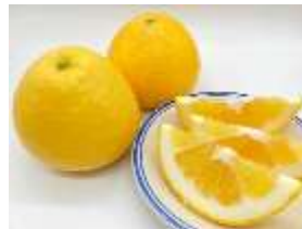
河内晩柑/愛媛県 しおかぜ 6号⇒こだま 720号 (東京駅 14:48着) ※5/17(金)のみ輸送 (JR四国)