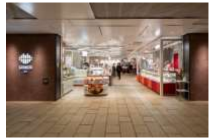
スイーツ・デリが揃う「京葉ストリートエリア」