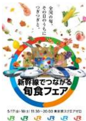
イベントポスターイメージ