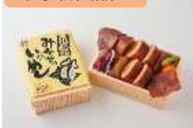
函館みかどのいかめし/北海道 はやぶさ 14号(東京駅 12:08着) (JR北海道)