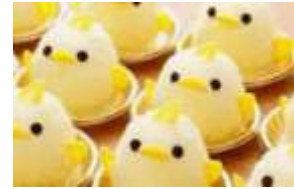
ぴよりん/愛知県 こだま 704号(東京駅 10:48着) (JR東海)