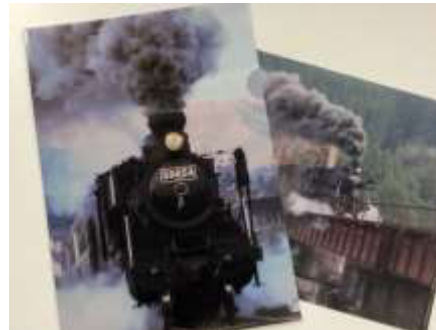
オリジナルクリアファイル