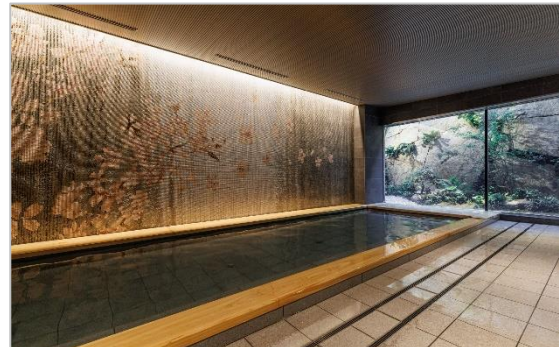
「THE BLOSSOM KYOTO」大浴場