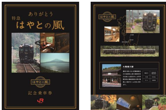
夏・秋バージョン（表面・裏面）