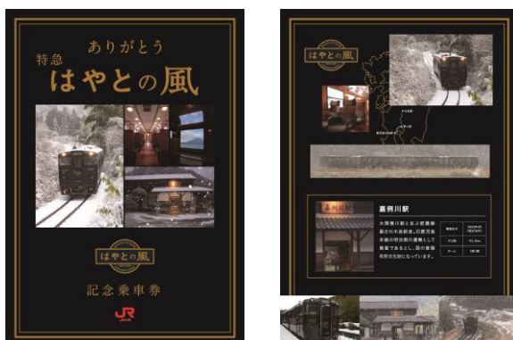
冬バージョン（表面・裏面）