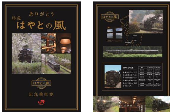
春バージョン（表面・裏面）