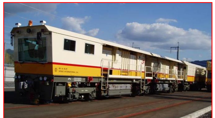
レール削正車の外観(同型車両)