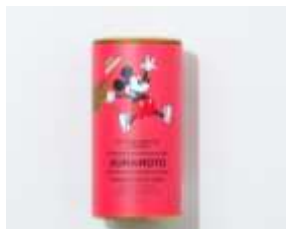
オリジナルデザイン缶熊本紅茶 1,600 円＋税