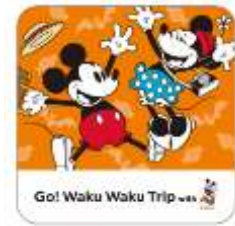
ステッカーイメージ