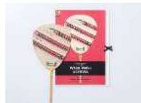
来民うちわ (新幹線) 1,700 円＋税