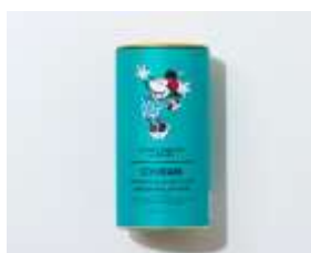
オリジナルデザイン缶知覧茶 1,600 円＋税