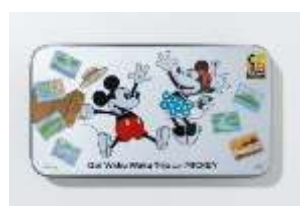
プリントクッキー缶 1,500 円＋税