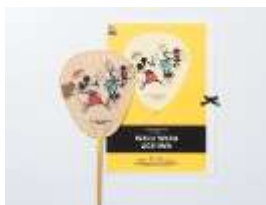
来民うちわ (ミッキー&ミニー) 1,700 円＋税