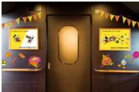
ハロウィン装飾イメージ

また、10月31日は、対象となる列車にご乗車いただいた方に、車内で特別なハロウィンステッカーをお配りします！記念にぜひご乗車ください！