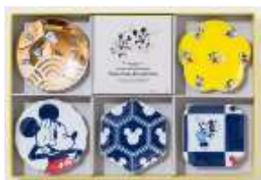
有田焼豆皿 5 枚セット 6,000 円＋税

オリジナルグッズに九州ならではのアイテムなど新たなグッズが登場します。 新グッズはオンラインショップなどで販売しますので、この機会にぜひお買い求めください！