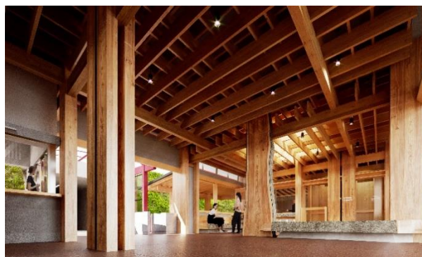
リニューアル後：イメージ（改札周辺）