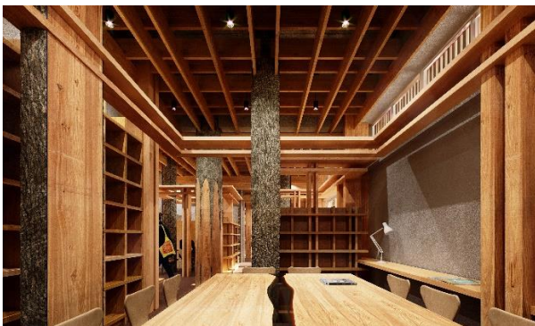
リニューアル後：イメージ（地域交流空間）