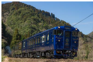
D&S列車「かわせみ やませみ」（外観）

九州旅客鉄道株式会社（以下、JR九州）では、日本マクドナルド株式会社のフランチャイジーとして運営する昭和フード株式会社とのタイアップで「特急 かわせみ やませみ」の佐世保特別運行によるオリジナルツアーを発売します。ドナルド・マクドナルド・ハウス 福岡開設10周年を記念して、当日はマクドナルドのキャラクターであるドナルド・マクドナルドが特急 かわせみ やませみに乗車し、車内イベントを行います。ぜひこの機会に「特急 かわせみ やませみ」で佐世保の旅に出かけてみませんか？ 皆さまのご参加をお待ちしております。