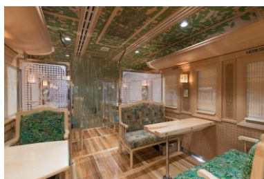
D&S列車「かわせみ やませみ」（内観）