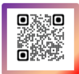
【 熊本支社公式 Instagram 】