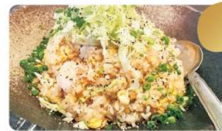
担々麺ちがや 海老レタス炒飯