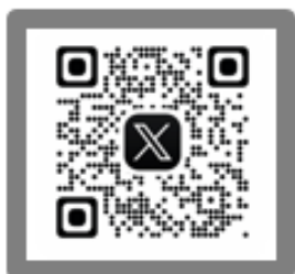
【 熊本支社公式 X 】