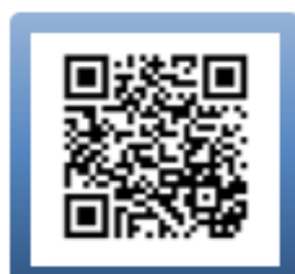
【 熊本支社公式 Facebook 】