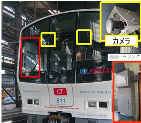
【例 1 線路等のメンテナンスへの活用】