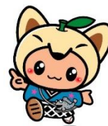
鹿島市キャラクター「かしまら」くん