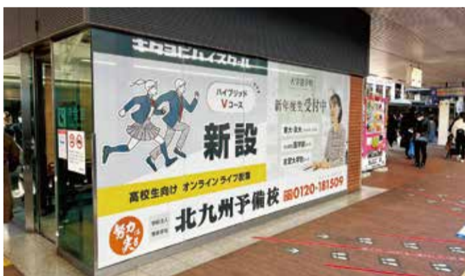
外側から見た様子