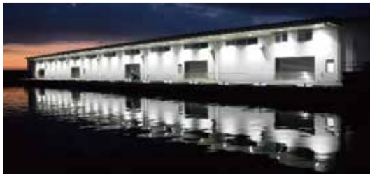
鐘崎漁港高度衛生管理型荷さばき所電気設備工事：福岡県(JR九州電気システム株式会社)