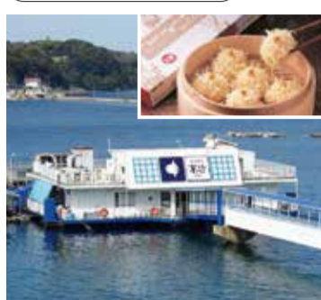
株式会社萬坊：佐賀県唐津市(レストラン、水産加工品製造・販売)