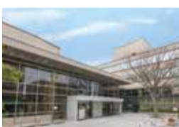
⑤福岡市立西市民センター