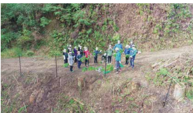
毎年実施している植樹活動の様子

ドローンは農林業分野において省人・省力化に寄与するほか、災害時の被災状況把握や人命救助に先立つ情報収集などにおいても重要な役割を果たします。JR九州商事はドローン人材の育成から、機体・機材の選定、利活用策の提案まで、ドローンの導入をワンストップでサポートします。自治体・行政機関の皆さまとともに、地域の特性に応じた導入案を検討いたしますので、お気軽にご相談ください。