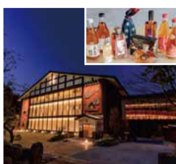
株式会社おおよま夢工房：大分県日田市(宿泊温泉施設、梅酒製造販売、道の駅運営)