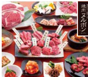
株式会社ヌルボン：福岡県福岡市(焼肉レストラン)