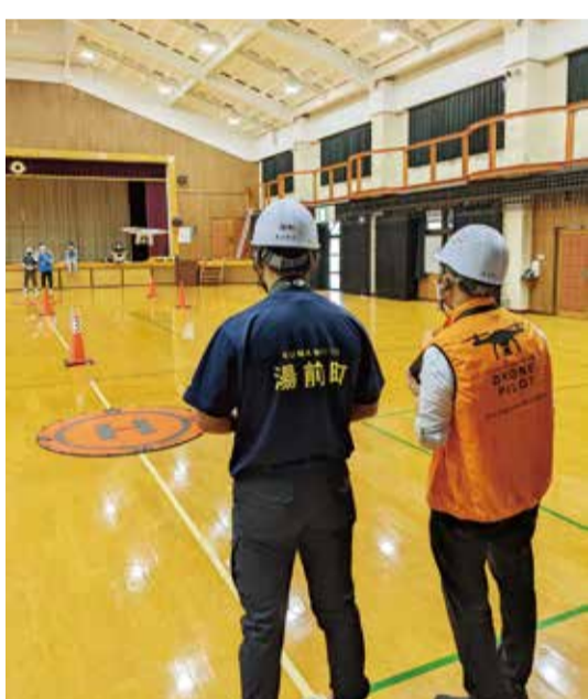
自治体職員を対象としたドローンスクールの様子

ドローンは農林業分野において省人・省力化に寄与するほか、災害時の被災状況把握や人命救助に先立つ情報収集などにおいても重要な役割を果たします。JR九州商事はドローン人材の育成から、機体・機材の選定、利活用策の提案まで、ドローンの導入をワンストップでサポートします。自治体・行政機関の皆さまとともに、地域の特性に応じた導入案を検討いたしますので、お気軽にご相談ください。