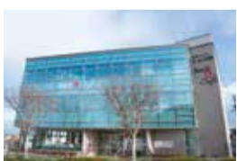
④情報プラザ人の駅