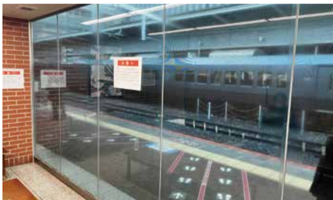
内側から見た様子