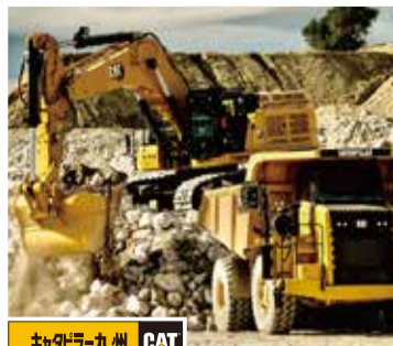
キャタピラー九州株式会社：福岡県筑紫野市(建設機械販売・レンタルサービス)