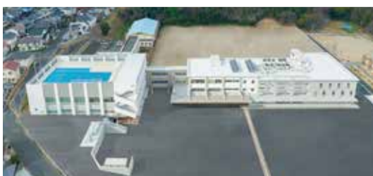
小池特別支援学校改築工事：福岡県(九鉄工業株式会社)