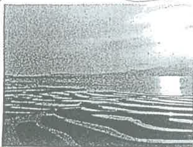
日本へ着100選 夕日100選