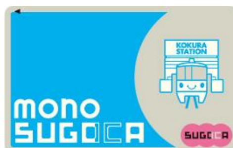
参考 「mono SUGOCA」のデザイン