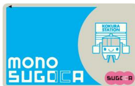
参考 「mono SUGOCA」のデザイン