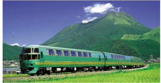
写真 ゆふいの森 外観

JR九州は、D & S 列車のひとつである特急列車「ゆふいの森」(キハ70形・キハ71形特急形気動車)に、乗り心地を向上させることを目的とした「可変減衰上下動ダンパーによる制振制御システム」を新たに搭載しました。これにより、上下振動は搭載前に比べて大幅に低減され、より快適にご利用頂けるようになります。