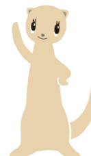
ニモカ 「フェレット」