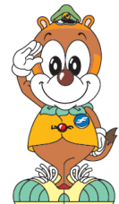
福岡市交通局 「ちかまる」

「PASMO」（PASMO協議会）・「SUGOCA」（JR九州）・「nimoca」（ニモカ）・「はやかけん」（福岡市交通局）は、鉄道やバス、商業施設などにご利用いただけるICカードです。