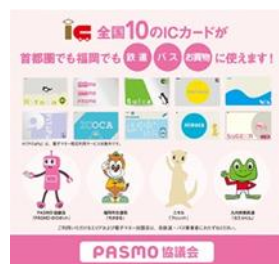
ポケットティッシュのデザイン