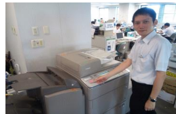
IC カード認証複合機

本社の複合機やプリンタにおいて IC カード認証機能の導入を進めています。利用状況の「見える化」やミスプリント防止機能の活用によりコピー用紙削減に努めています。