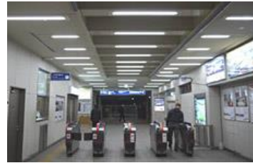
改札口の照明のLED化

2013 年度は行橋駅をはじめ約 219 の駅と駅商業施設、列車内などに設置しました。2013 年度末、累計で約 46,500 台となりました。