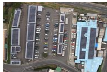
JR九州エコホス(株)本社及び工場

本社及び工場屋根全面に太陽光発電パネルを設置し、発電を開始しました。従来からの蒸気回収システムなどの取り組みも含めて会社全体で環境保全に努めています。