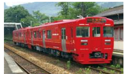
キハ 220 形