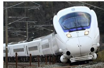
885系「白いかもめ・白いソニック」