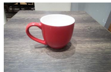
店内用マグカップ

各店舗において、材料の発注から商品作成まで計画的に行うとともに、一部店舗では陶器カップでの提供を行っています。