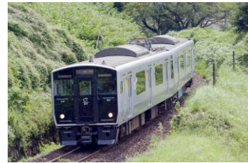
非電化区間を試験走行する蓄電池電車

電化されていない線区を走行する次世代の車両として、大容量の蓄電池を搭載した電車の走行試験を 2013 年度に行いました。