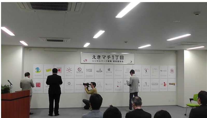
審査会場全景（候補30作品）