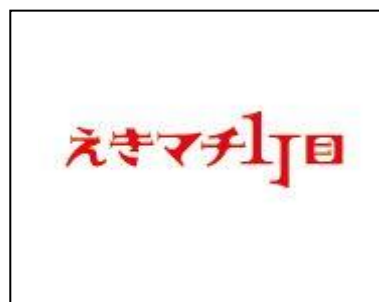
竹中隆雄 様の作品