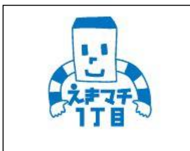
渡辺信一 様の作品