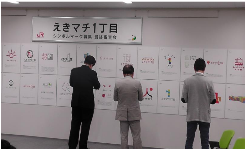
審査員3名による審査風景