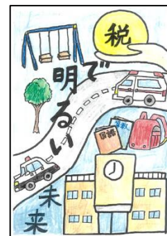
（贈呈 NFT イメージ：「公益社団法人山鹿法人会 会長賞」受賞作品）