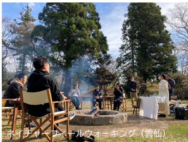
ネイチャーファイナルウォーキング（雲仙）