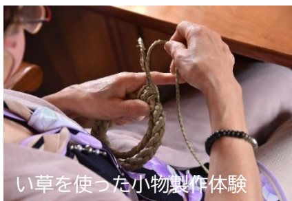
い草を使った小物製作体験