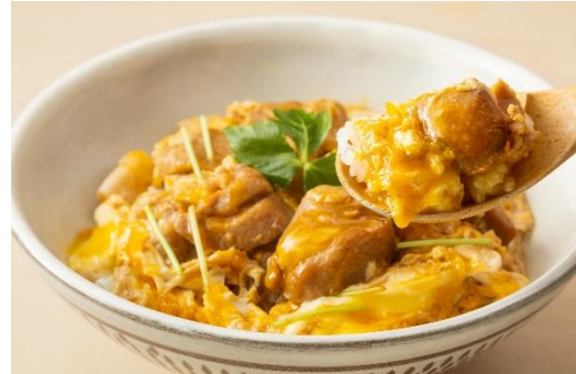
うちのたまごの親子丼