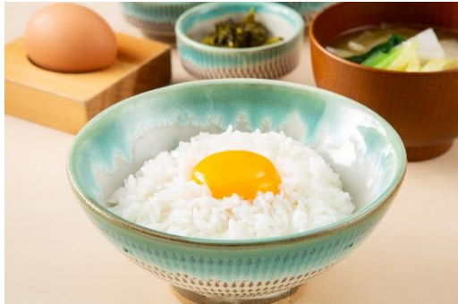
たまごかけごはん