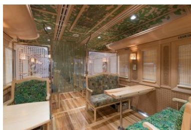
D&S列車「かわせみ やませみ」（内観）