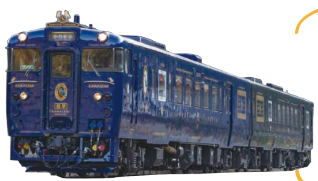
特急 かわせみ やませみ