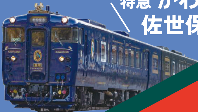
特急 かわせみ やませみ