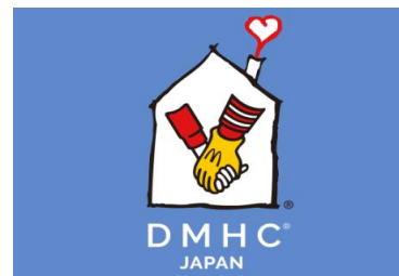
ドナルド・マクドナルド・ハウス支援