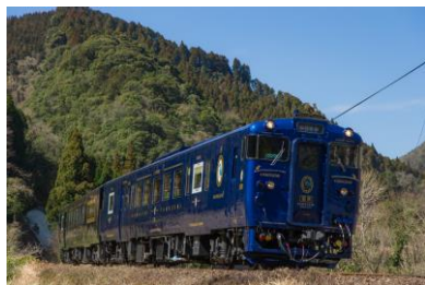
D&S列車「かわせみ やませみ」（外観）

九州旅客鉄道株式会社（以下、JR九州）では、日本マクドナルド株式会社のフランチャイジーとして運営する昭和フード株式会社とのタイアップで「特急 かわせみ やませみ」の佐世保特別運行によるオリジナルツアーを発売します。ドナルド・マクドナルド・ハウス 福岡開設10周年を記念して、当日はマクドナルドのキャラクターであるドナルド・マクドナルドが特急 かわせみ やませみに乗車し、車内イベントを行います。ぜひこの機会に「特急 かわせみ やませみ」で佐世保の旅に出かけてみませんか？ 皆さまのご参加をお待ちしております。