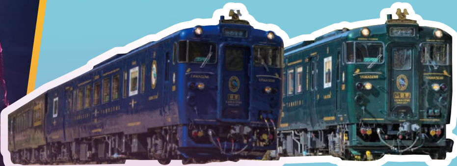
特急 かわせみやませみ