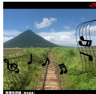
【癒しの鉄道サウンド NFT・指宿枕崎線】