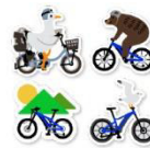
Yamaha E-Ride Base オリジナルアクリル キーホルダー（非売品） 先着順でなくなり次第終了