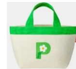
Nintendo TOKYO/OSAKA/KYOTO 取扱商品