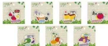
ダイカットステッカー ※ご当地柄のみ