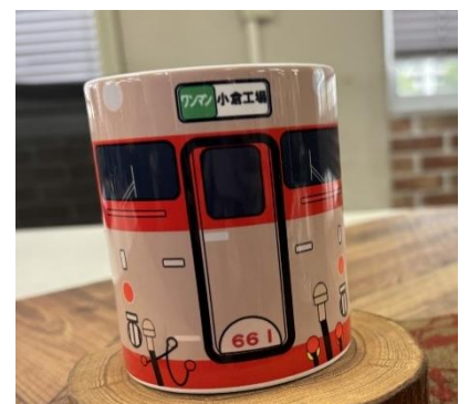
（一例）キハ 66・67 形国鉄色 オリジナルマグカップ （2,000 円／個）