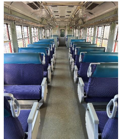
（車内イメージ） キハ 66・67 形国鉄色