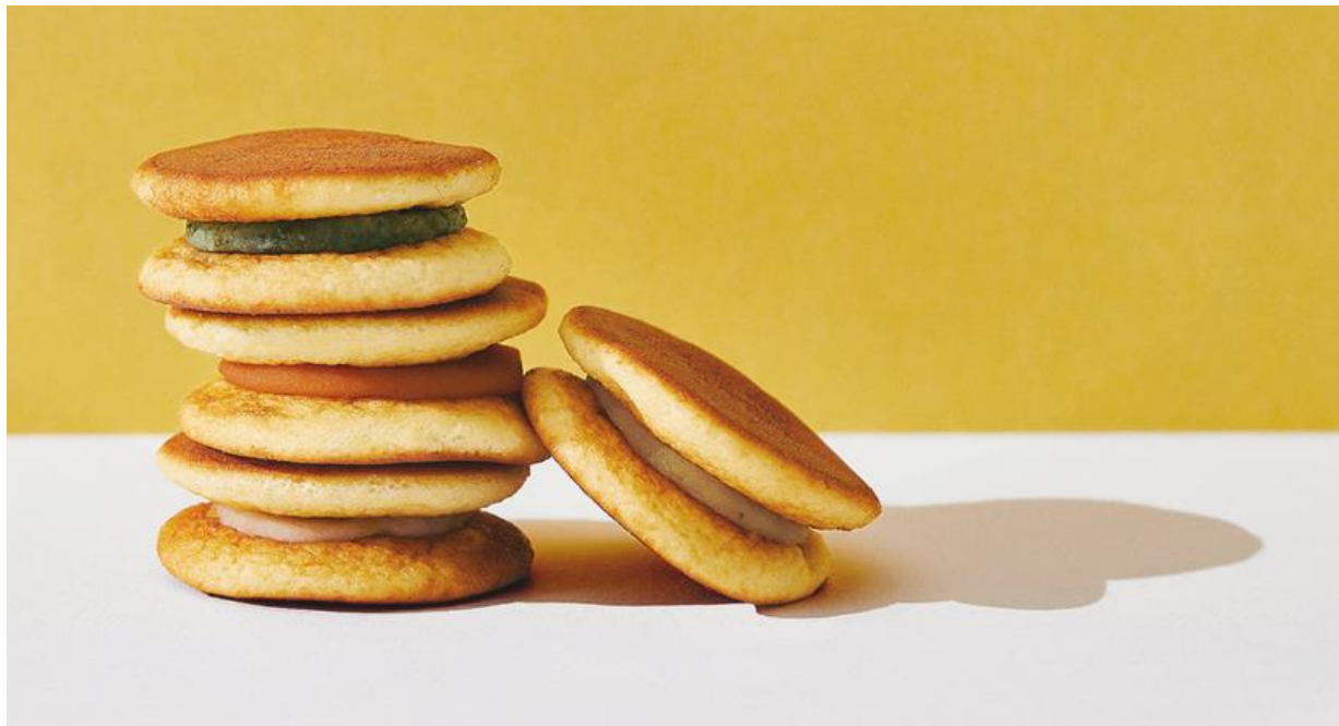
(写真) 博多運盛「うんどら」

今回のイベントを通して、おいしい運を贈り、皆さまにもっと幸せで元気に、笑顔になっていただきたいと心より願っています。