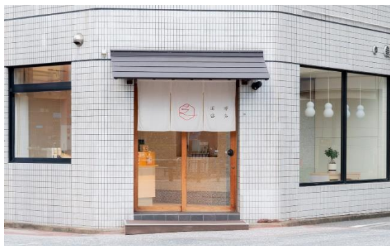
博多運盛 (川端町店)