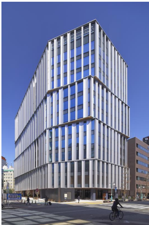
筑紫口中央通り(西側)から

本ビルは、福岡県の敷地を有効活用するとともに、福岡市において官民連携で推進する「博多コネクティッド」(※1)をはじめ福岡市のプロジェクトである「都心の森1万本プロジェクト」(※2)「Fukuoka Art Next」(※3)にも参画し、博多駅周辺のまちづくりの一役を担ってまいります。