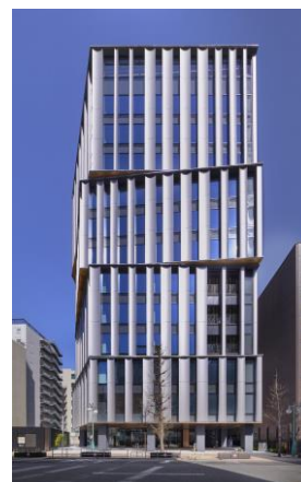
筑紫口中央通り(正面)から

「デンマーク王立図書館」をはじめ世界で多くの実績を持つ建築デザイン事務所「シュミット・ハマー・ラッセン・アーキテクト」（デンマーク）によるデザインです。3層毎に分節し、周囲に対して様々な角度で向き合うことで周囲のまちなみと調和します。縦基調のラインは景観にリズムを与え、とともに、筑紫口エリアの成長と発展を象徴します。