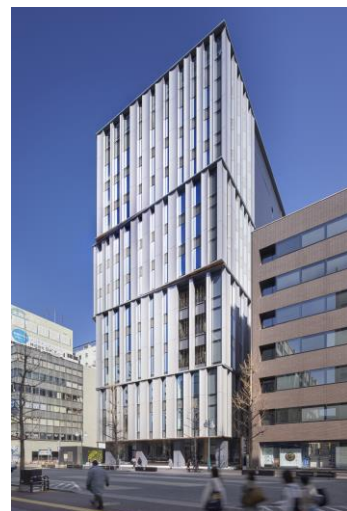
筑紫口中央通り(東側)から