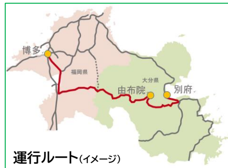
運行ルート(イメージ)