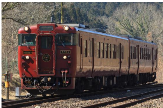
キハ47形特急いさぶろう・しんぺい

※キハ47形特急いさぶろう・しんぺい:2023年10月4日 小倉総合車両センター入場